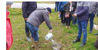
Station 4: VERSICKERUNGSRING