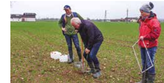
Station 2: BODENSONDE