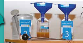
Station 3: TRÜBUNGSFLASCHE