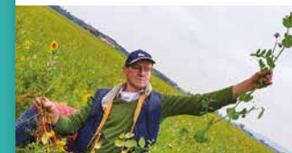
Station 9: ZEIGERPFLANZEN