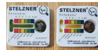
Station 6: pH-WERT