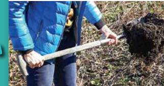
Station 1: SPATEN

physikalisch Station: 1 - 5 chemisch Station: 6 - 7 biologisch Station: 8-10