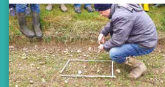
Station 5: HOLZKUGEL