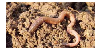
Station 10: BODENLEBEWESEN