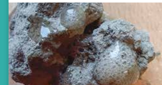
Station 7: SALZSÄURE